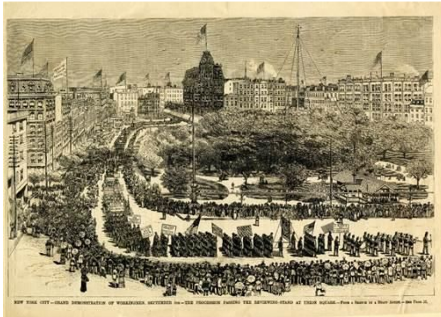
紐約市--九月五日勞工大遊行--遊行隊伍行經聯合廣場的觀看區。 此圖於1882年九月十六日於Frank Leslie's Illustrated Newspaper刊登。木版畫。私人收藏。