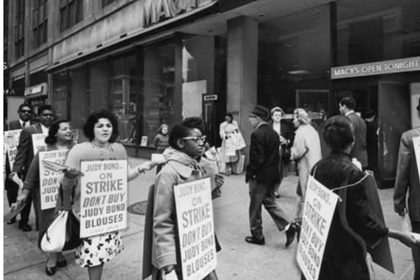
國際婦女服裝工人聯合會在梅西百貨外進行罷工，告訴消費者不要購買Judy Bond的服飾。 圖片攝於1965年，由康乃爾大學勞工管理資料庫Kneel Center所提供。

展覽的第三部分“Sea Change”聚焦於1965年至2001年。在之前的數十年內，成千上萬的移民人口加入了南方非裔美國人以及波多黎各人的行列來到紐約尋求工作機會。1975年，紐約面臨財務危機，以及地方與國家政治的反工會情懷的日益增長，導致了發起勞工運動的困難度。碰巧，法院以及聯邦單位同時也決定減少對於勞工法律上的保障。許多紐約客也擔心工會合約對市府造成負擔，也適逢全國的工會會員人數驟減趨勢，種種因素也造成工會在經濟與政治權力長期的衰退。在1960年至2000年期間，許多企業走向自動化，甚或外移以尋求較低的工資以及稅務，紐約市失去了超過650,000個製造生產的基層工作。